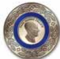
Obr. 5 Odznam Paul Harris Fellow Award