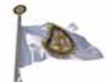
Obr. 1 Vlajka Rotary