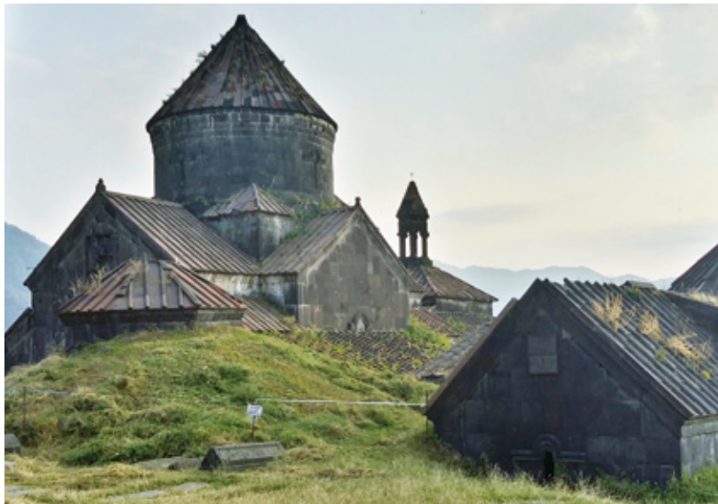
Malebný klášter Haghpát Vpravo: Rotariáni na cestách