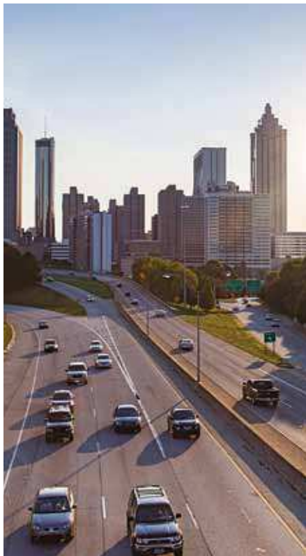
Panorama Atlanty od mostu k Jackson Street.

VPRAVO Kamenná hora vystavuje artefakty a informace o událostech za posledních 12 tisíc let. Z centra Atlanty je to ke Kamenné hoře jen 30 minut a dozvíte se tam vše o jejím vzniku, o přírodě a o tematickém parku