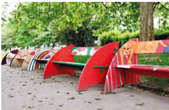
Prezentaci chystá také plzeňský klub se svým projektem Lavičky

sedy Výboru pro zahraniční věci, obranu a bezpečnost Senátu Parlamentu České republiky Inter Country Meeting mezinárodních výborů Rotary za účasti členů evropských Rotaract klubů. Setkání bude pokračovat již zmíněným benefičním varhanním koncertem a po něm společným posezením v pivovaru U Medvídků.