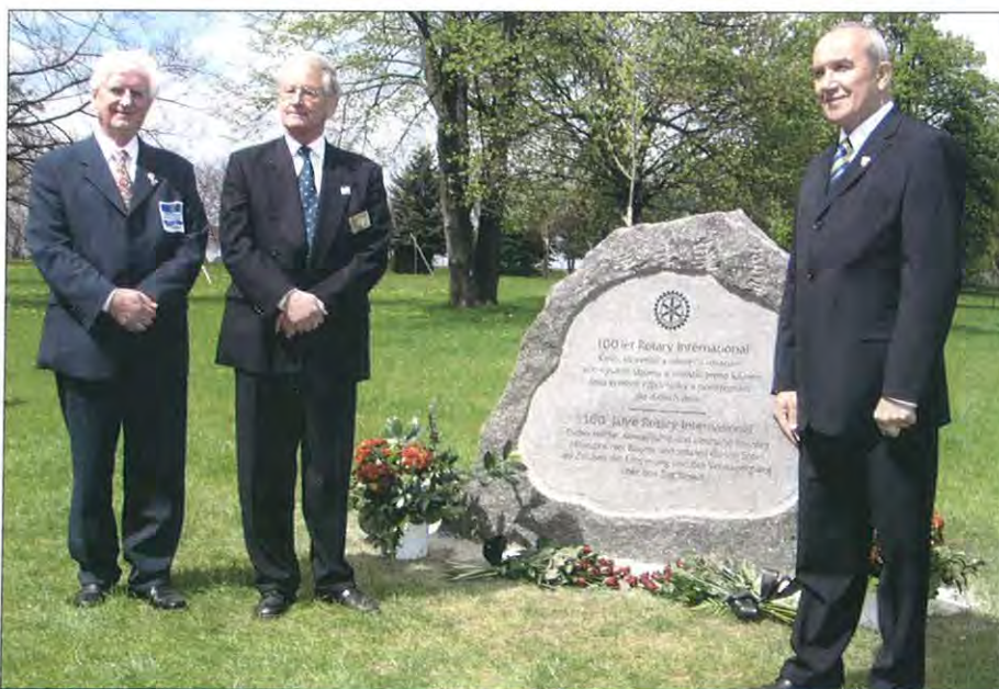
Ve vstupním prostoru Památníku Lidice byl odhalen pamětní kámen a vysazeno pět pamětních stromů.

Prohlédli si také již dokončené expozice památníku, jehož generální rekonstrukce probíhá z rozhodnutí vlády ČR od roku 2001.