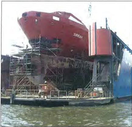
Do Hamburku, jednoho z největších přístavů v Evropě, přivážejí tisíce lodí nejen zboží, ale i pasažéry. Proslavené jsou i hamburské suché doky.

Díky pohostinnosti místních rotariánů jsme tak měli příležitost seznámit se alespoň krátce s Hamburkem, krásným velkoměstem s 1,7 mil. obyvatel, plným nejen vody z Labe i z jejího přítoku Alster (jak se na světový přístav také sluší), ale také zdobeným nekonečnými stromořadími a parky. Však Hamburk je prý nejzelenějším městem Evropy.