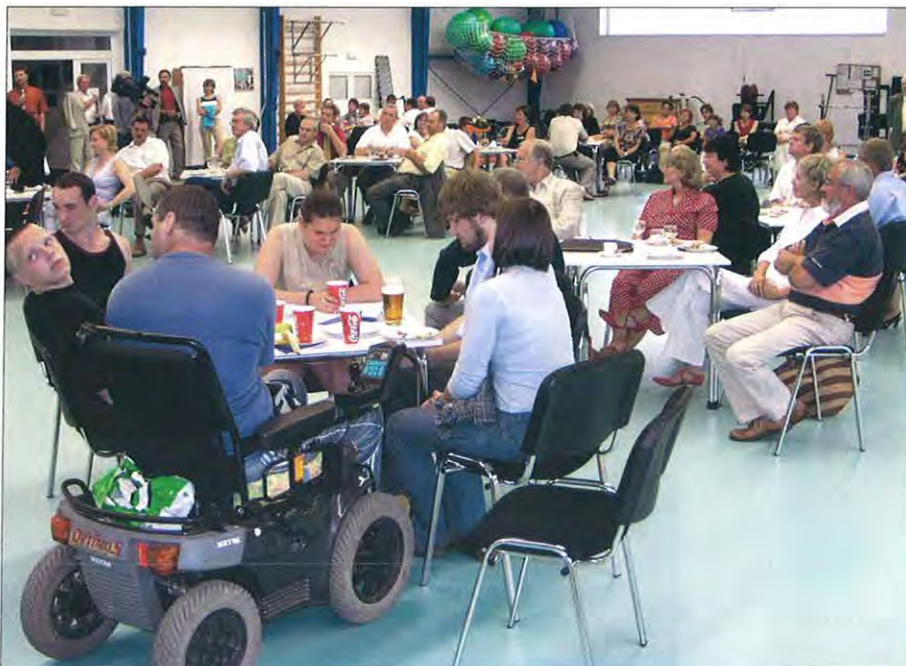
Klienti českobudějovického centra zdravotně postižených měli z nových trenažérů upřímnou radost.

Středa 29. června byla pro klienty Prvního centra zdravotně postižených Jihočeského kraje v Českých Budějovicích nejen dnem slavnostním, ale i dnem, na který se všichni už dlouhou dobu nesmírně těšili. Zástupci RC České Budějovice a partnerského RC Herzogenaurach (Německo, D. 1950) jim předali do užívání téměř dvě desítky rehabilitačních a posilovacích zařízení v hodnotě 32 000 EUR (včetně účelové dotace od Nadace Rotary).