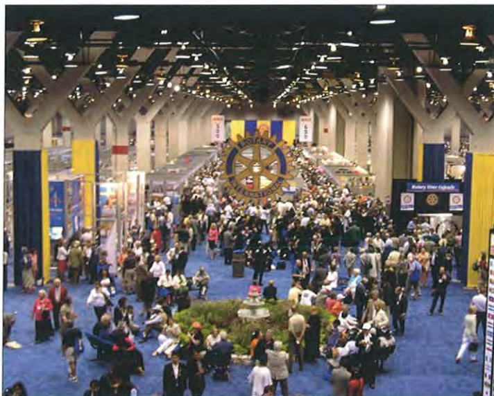
„House of Friendship“, kde byly prezentovány všestranné aktivity Rotary.

Vyvrcholení oslav 100. výročí založení Rotary v Chicagu