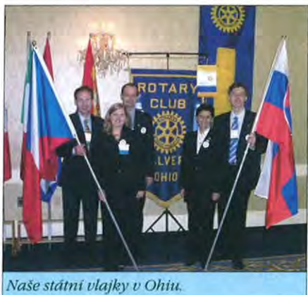
Naše státné vlajky v Ohiu.

Skupina štyroch mladých ľudí z rôznych kútov ČR a SR a rôznych profesií - to bol tím vybraný pre GSE do Ohia, dištrikt 6650.