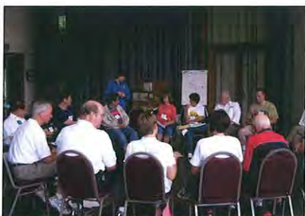
Pracovní setkání při workshopu.

RYLA je zkratkou pro „Rotary Youth Leadership Award“, tedy seminář pro mladé talentované vůdčí osobnosti.