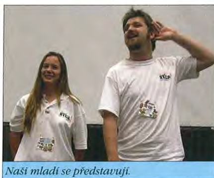
Naši mladí se představují.