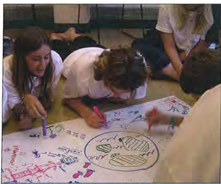
Při kolektivní tvorbě.

Atmosféra tohoto mezinárodního setkání byla úžasná. Bylo radost sledovat, jak mladí lidé různých národností hltají zkušenosti a názory opravdových vůdců ze společenského i rotariánského života a získané informace obratem využívají při workshopu, zaměřených na rozvoj vůdčovství.