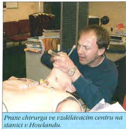
Praxe chirurga ve vzdělávacím centru na stanici v Howlandu.