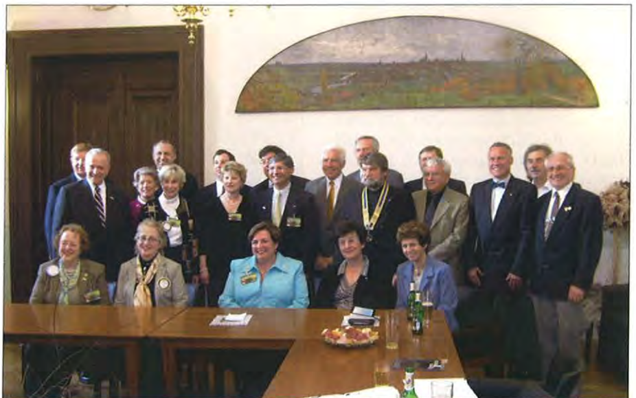
Setkání se vzácnými hosty z Birminghamu v primátorském salonku.