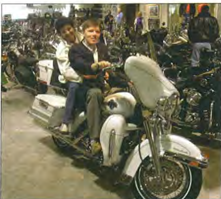
U dealera Harley Davidson v Boardmanu.

Fenoménom Ohia je život v kluboch. Pohybovali sme sa po severovýchode Ohia, pri hraniciach s Pennsylvaniou a West Virginiou v prostredí malých miest s vidieckym charakterom, na území veľkom asi ako jeden zo slovenských krajov. Na tomto relatívne malom území