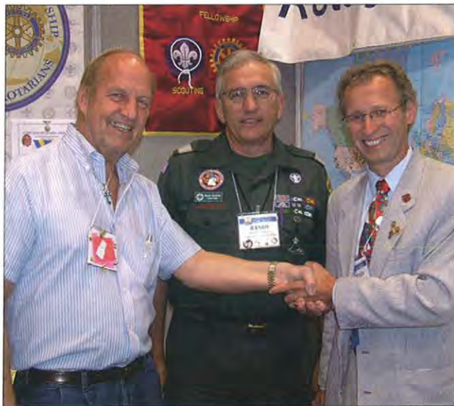
Přátelské setkání s rotariány podporujícími skauting.

Mám-li být upřímný, byl jsem příjemně překvapen. Čím? Bezvadnou organizací, profesionální moderací a vystoupením řečníků, mediálními show, doprovodnými programy a zejména přátelskou atmosférou zde panující. Bylo příjemné potkávat rotariány z různých zemí, kteří se hlásili k našemu distriktu a oceňovali spolupráci s našimi kluby. Například jeden past-governér z Brazílie oceňoval při našem náhodném setkání u jídla pomoc RC České Budějovice se zajištěním inzulinu, který v určitém období byl u nich nedostatkový.