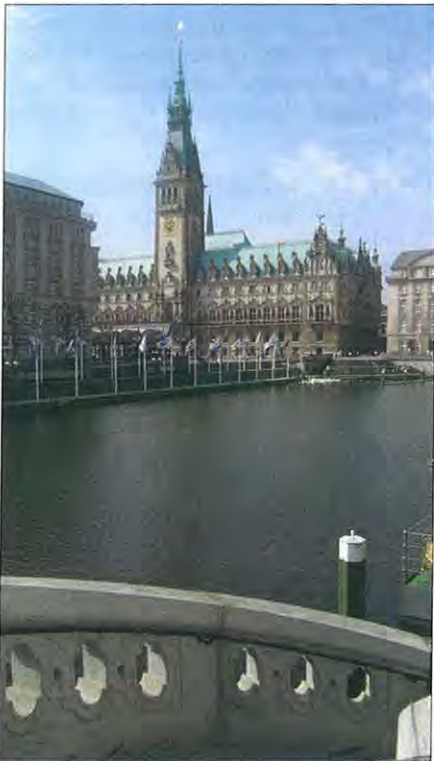
Dominantou centra Hamburku je novorenesanční radnice.

Díky pohostinnosti místních rotariánů jsme tak měli příležitost seznámit se alespoň krátce s Hamburkem, krásným velkoměstem s 1,7 mil. obyvatel, plným nejen vody z Labe i z jejího přítoku Alster (jak se na světový přístav také sluší), ale také zdobeným nekonečnými stromořadími a parky. Však Hamburk je prý nejzelenějším městem Evropy.