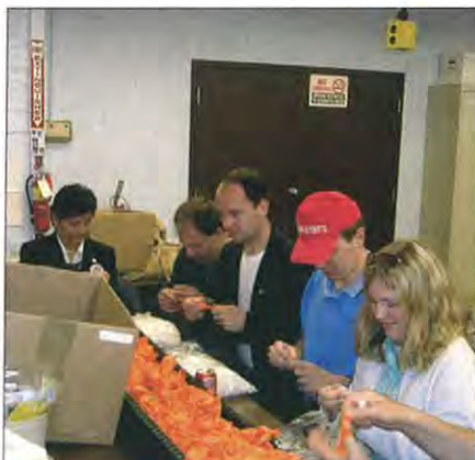
Pomoc mentálně postiženým při skládání balónek v Carroltonu.

Samozřejmě ne všichni jsou tak otevření, spousta Američanů opravdu