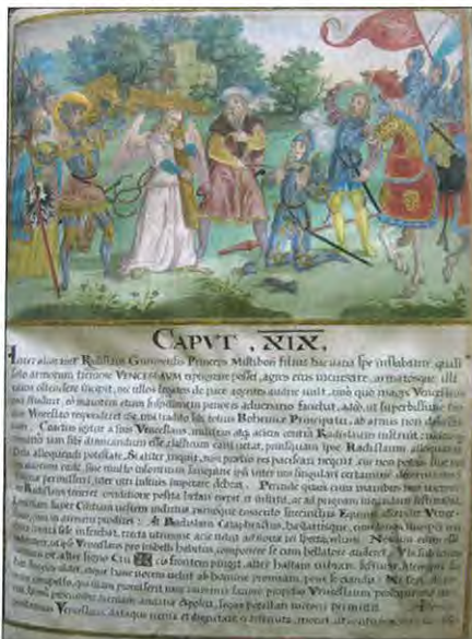
Jeden ze vzácných iluminovaných listů o životě sv. Václava z 2. poloviny 16. století.

Zcela mimořádné a nečekané bylo ovšem ještě před odletem domů setkání